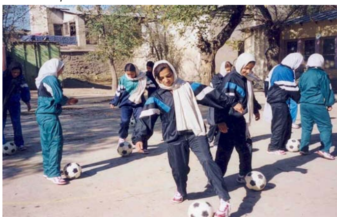
Séance d'entraînement dans le cadre d'un séminaire de football féminin.