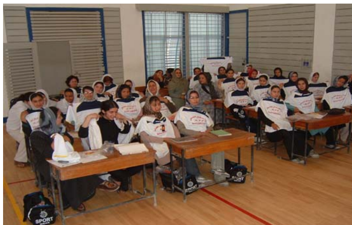
Cours théorique à Kabul.

Quand Joseph S. Blatter lançait en 1995 que « l'avenir est féminin », ce n'était pas juste un slogan - cela impliquait l'intime conviction que le football féminin recèle un extraordinaire potentiel. Depuis lors, la FIFA soutient de manière ciblée les initiatives des associations qui souhaitent offrir aux féminines les mêmes chances de développement qu'à leurs homologues masculins. Depuis que le Programme d'Aide Financière de la FIFA (FAP) a vu le jour en 1998, les associations et confédérations sont tenues d'investir dans le football féminin, depuis 2004 à hauteur de 4% des sommes allouées et depuis 2005 à hauteur de 10%. Cela intervient en parallèle de la promotion globale du football féminin par des financements directs et par l'organisation de compétitions et séminaires. Par le biais de ses programmes de développement, la FIFA joue un rôle actif dans la formation dans des domaines comme administration, entraînement, arbitrage et médecine du sport.