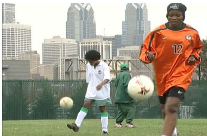
Terrain d'entraînement sur le toit d'un bâtiment à Alger.

Quand Joseph S. Blatter lançait en 1995 que « l'avenir est féminin », ce n'était pas juste un slogan - cela impliquait l'intime conviction que le football féminin recèle un extraordinaire potentiel. Depuis lors, la FIFA soutient de manière ciblée les initiatives des associations qui souhaitent offrir aux féminines les mêmes chances de développement qu'à leurs homologues masculins. Depuis que le Programme d'Aide Financière de la FIFA (FAP) a vu le jour en 1998, les associations et confédérations sont tenues d'investir dans le football féminin, depuis 2004 à hauteur de 4% des sommes allouées et depuis 2005 à hauteur de 10%. Cela intervient en parallèle de la promotion globale du football féminin par des financements directs et par l'organisation de compétitions et séminaires. Par le biais de ses programmes de développement, la FIFA joue un rôle actif dans la formation dans des domaines comme administration, entraînement, arbitrage et médecine du sport.