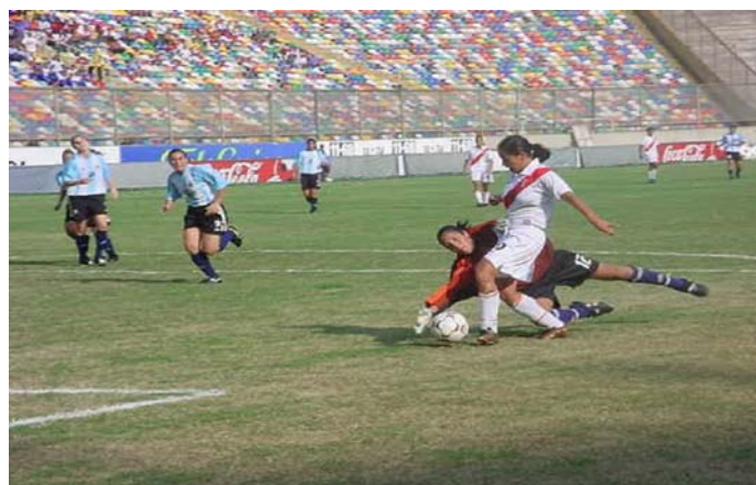
Rencontre au sommet : Pérou - Argentine (lors d'un tournoi au Pérou).

Quand Joseph S. Blatter lançait en 1995 que « l'avenir est féminin », ce n'était pas juste un slogan - cela impliquait l'intime conviction que le football féminin recèle un extraordinaire potentiel. Depuis lors, la FIFA soutient de manière ciblée les initiatives des associations qui souhaitent offrir aux féminines les mêmes chances de développement qu'à leurs homologues masculins. Depuis que le Programme d'Aide Financière de la FIFA (FAP) a vu le jour en 1998, les associations et confédérations sont tenues d'investir dans le football féminin, depuis 2004 à hauteur de 4% des sommes allouées et depuis 2005 à hauteur de 10%. Cela intervient en parallèle de la promotion globale du football féminin par des financements directs et par l'organisation de compétitions et séminaires. Par le biais de ses programmes de développement, la FIFA joue un rôle actif dans la formation dans des domaines comme administration, entraînement, arbitrage et médecine du sport.