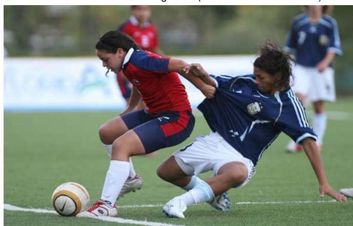
Scène du match Argentine - Chili