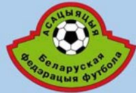
Emblème de l'association