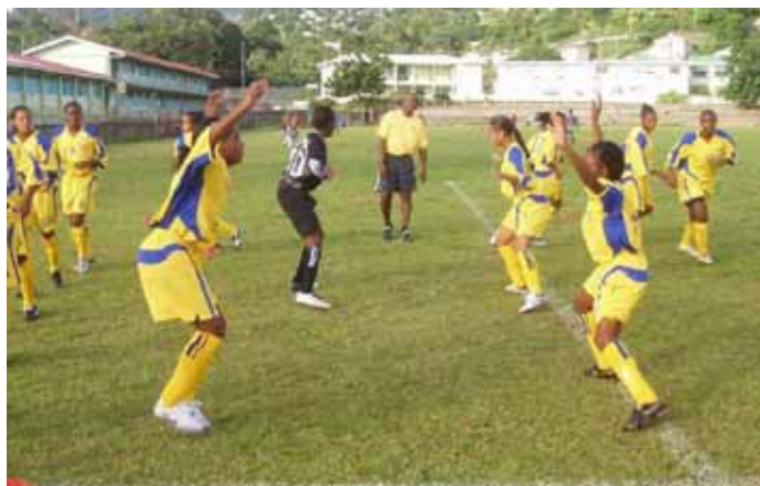
Est-ce un entraînement de football ou une séance de danse ?

Quand Joseph S. Blatter lançait en 1995 que « l'avenir est féminin », ce n'était pas juste un slogan - cela impliquait l'intime conviction que le football féminin recèle un extraordinaire potentiel. Depuis lors, la FIFA soutient de manière ciblée les initiatives des associations qui souhaitent offrir aux féminines les mêmes chances de développement qu'à leurs homologues masculins. Depuis que le Programme d'Aide Financière de la FIFA (FAP) a vu le jour en 1998, les associations et confédérations sont tenues d'investir dans le football féminin, depuis 2004 à hauteur de 4% des sommes allouées et depuis 2005 à hauteur de 10%. Cela intervient en parallèle de la promotion globale du football féminin par des financements directs et par l'organisation de compétitions et séminaires. Par le biais de ses programmes de développement, la FIFA joue un rôle actif dans la formation dans des domaines comme administration, entraînement, arbitrage et médecine du sport.