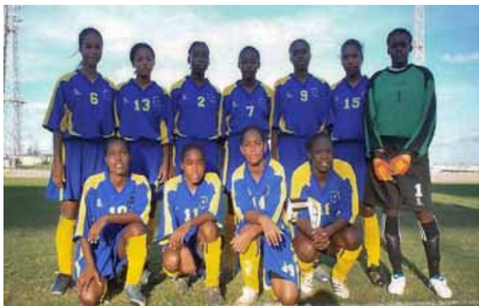
L'équipe nationale féminine de la Barbade.

oui 2006 7 12 92 oui non non oui non oui U-20