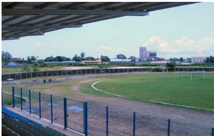
Stade Divonguy, Port Gentil

Informations additionnels sur le programme: http://fr.fifa.com/mm/goalproject/WinAF_F.pdf