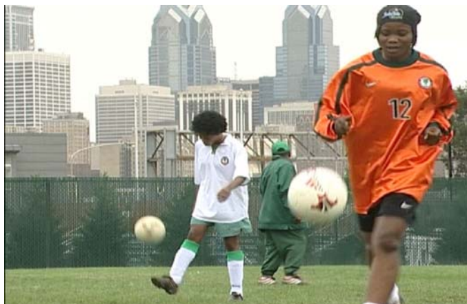
Terrain d'entraînement sur le toit d'un bâtiment à Alger.

Quand Joseph S. Blatter lançait en 1995 que « l'avenir est féminin », ce n'était pas juste un slogan - cela impliquait l'intime conviction que le football féminin recèle un extraordinaire potentiel. Depuis lors, la FIFA soutient de manière ciblée les initiatives des associations qui souhaitent offrir aux féminines les mêmes chances de développement qu'à leurs homologues masculins. Depuis que le Programme d'Aide Financière de la FIFA (FAP) a vu le jour en 1998, les associations et confédérations sont tenues d'investir dans le football féminin, depuis 2004 à hauteur de 4% des sommes allouées et depuis 2005 à hauteur de 10%. Cela intervient en parallèle de la promotion globale du football féminin par des financements directs et par l'organisation de compétitions et séminaires. Par le biais de ses programmes de développement, la FIFA joue un rôle actif dans la formation dans des domaines comme administration, entraînement, arbitrage et médecine du sport.