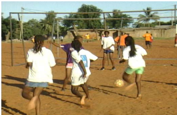
Séance d'entraînement sur une surface typique d'un pays sèche.