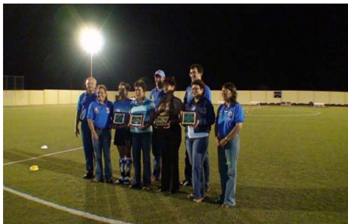
La commission du football féminin de la Fédération de Football d'Aruba.

Quand Joseph S. Blatter lançait en 1995 que « l'avenir est féminin », ce n'était pas juste un slogan - cela impliquait l'intime conviction que le football féminin recèle un extraordinaire potentiel. Depuis lors, la FIFA soutient de manière ciblée les initiatives des associations qui souhaitent offrir aux féminines les mêmes chances de développement qu'à leurs homologues masculins. Depuis que le Programme d'Aide Financière de la FIFA (FAP) a vu le jour en 1998, les associations et confédérations sont tenues d'investir dans le football féminin, depuis 2004 à hauteur de 4% des sommes allouées et depuis 2005 à hauteur de 10%. Cela intervient en parallèle de la promotion globale du football féminin par des financements directs et par l'organisation de compétitions et séminaires. Par le biais de ses programmes de développement, la FIFA joue un rôle actif dans la formation dans des domaines comme administration, entraînement, arbitrage et médecine du sport.