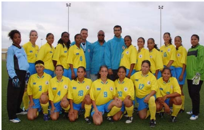
La sélection féminine en 2006.