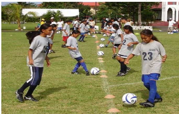
Bonnes perspectives pour les générations futures des Samoa américaines.