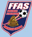
Emblème de l'association