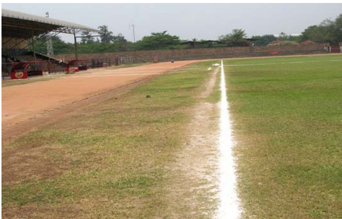
Le stade Prince Louis Rwagasore avant la rénovation du terrain.

Informations additionnels sur le programme: http://fr.fifa.com/mm/goalproject/WinAF_F.pdf