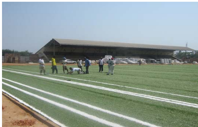
Impressions des travaux de rénovation.