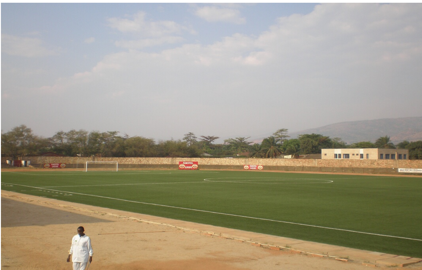
Ce nouveau terrain en gazon artificiel a accueilli le tournoi international U-17 de la CECAFA en août 2007 auquel ont participé huit équipes.