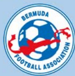
Emblème de l'association