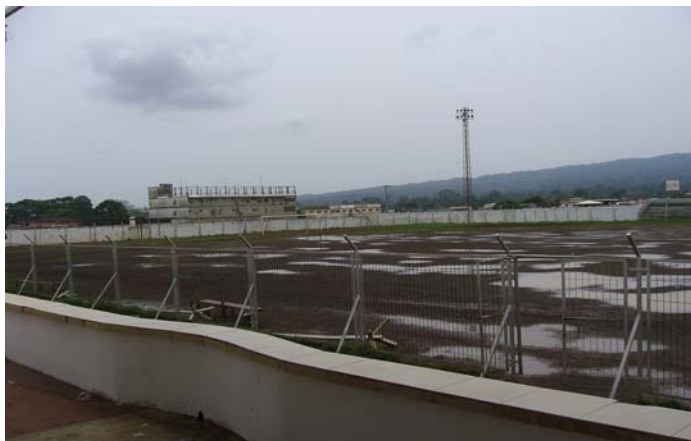
Estadio La Paz, Malabo

Informations additionnels sur le programme: http://fr.fifa.com/mm/goalproject/WinAF_F.pdf