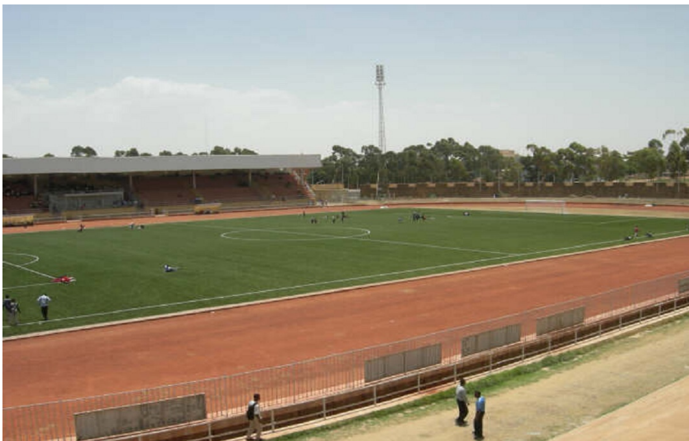
Le stade Asmara peu avant sa réouverture.