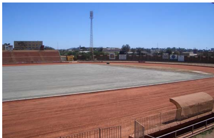
Préparation du terrain.