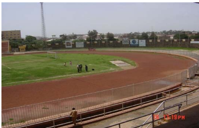
Le stade Asmara avant l'installation d'un gazon artificiel.

Informations additionnels sur le programme: http://fr.fifa.com/mm/goalproject/WinAF_F.pdf