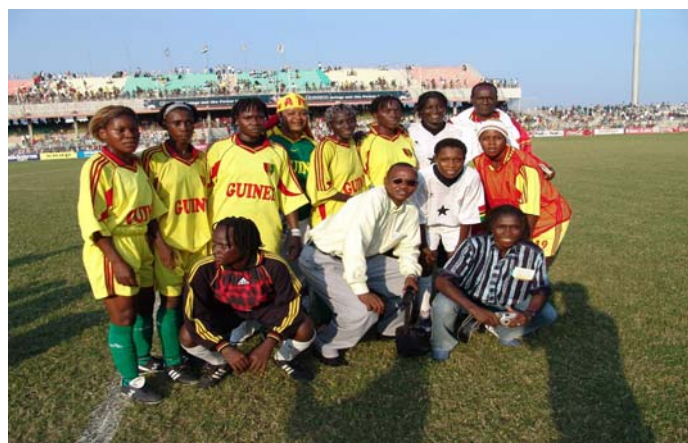
L'équipe féminine de Guinée

Quand Joseph S. Blatter lançait en 1995 que « l'avenir est féminin », ce n'était pas juste un slogan - cela impliquait l'intime conviction que le football féminin recèle un extraordinaire potentiel. Depuis lors, la FIFA soutient de manière ciblée les initiatives des associations qui souhaitent offrir aux féminines les mêmes chances de développement qu'à leurs homologues masculins. Depuis que le Programme d'Aide Financière de la FIFA (FAP) a vu le jour en 1998, les associations et confédérations sont tenues d'investir dans le football féminin, depuis 2004 à hauteur de 4% des sommes allouées et depuis 2005 à hauteur de 10%. Cela intervient en parallèle de la promotion globale du football féminin par des financements directs et par l'organisation de compétitions et séminaires. Par le biais de ses programmes de développement, la FIFA joue un rôle actif dans la formation dans des domaines comme administration, entraînement, arbitrage et médecine du sport.