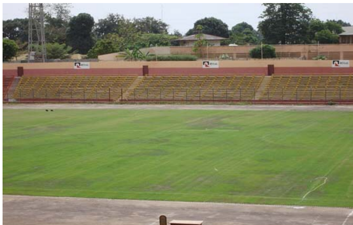
Stade Annexe 28 septembre, Conakry – Capacité d'accueil : 21 000 spectateurs.

Informations additionnels sur le programme: http://fr.fifa.com/mm/goalproject/WinAF_F.pdf