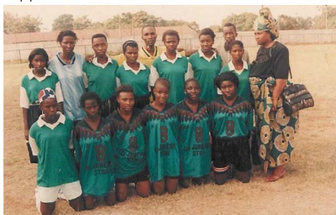
Une équipe de club guinéenne