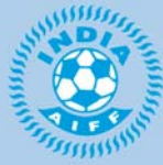
Emblème de l'association