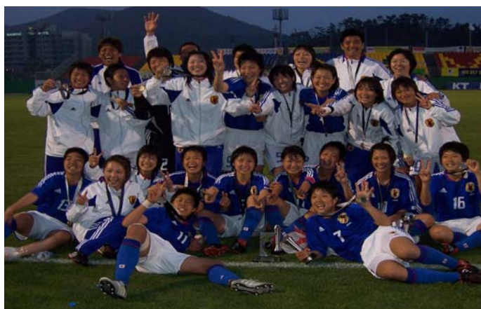
L'équipe nationale féminine des moins de seize ans.

Quand Joseph S. Blatter lançait en 1995 que « l'avenir est féminin », ce n'était pas juste un slogan - cela impliquait l'intime conviction que le football féminin recèle un extraordinaire potentiel. Depuis lors, la FIFA soutient de manière ciblée les initiatives des associations qui souhaitent offrir aux féminines les mêmes chances de développement qu'à leurs homologues masculins. Depuis que le Programme d'Aide Financière de la FIFA (FAP) a vu le jour en 1998, les associations et confédérations sont tenues d'investir dans le football féminin, depuis 2004 à hauteur de 4% des sommes allouées et depuis 2005 à hauteur de 10%. Cela intervient en parallèle de la promotion globale du football féminin par des financements directs et par l'organisation de compétitions et séminaires. Par le biais de ses programmes de développement, la FIFA joue un rôle actif dans la formation dans des domaines comme administration, entraînement, arbitrage et médecine du sport.