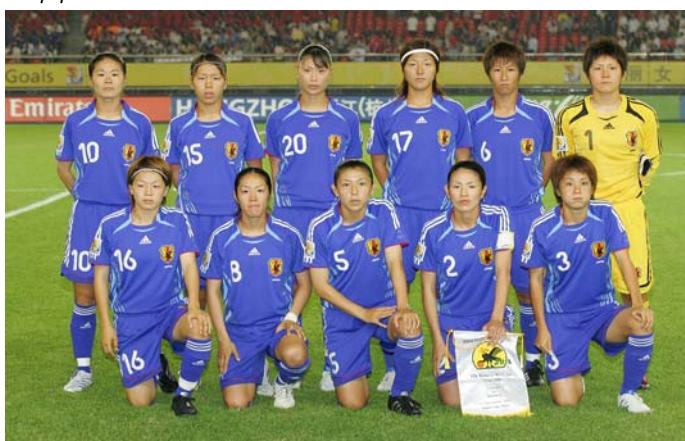
La sélection féminine « A » du Japon.