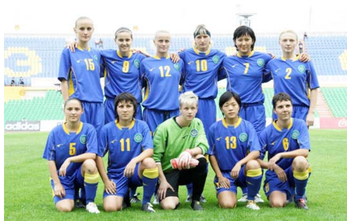
L'équipe nationale féminine de Kazakhstan

Quand Joseph S. Blatter lançait en 1995 que « l'avenir est féminin », ce n'était pas juste un slogan - cela impliquait l'intime conviction que le football féminin recèle un extraordinaire potentiel. Depuis lors, la FIFA soutient de manière ciblée les initiatives des associations qui souhaitent offrir aux féminines les mêmes chances de développement qu'à leurs homologues masculins. Depuis que le Programme d'Aide Financière de la FIFA (FAP) a vu le jour en 1998, les associations et confédérations sont tenues d'investir dans le football féminin, depuis 2004 à hauteur de 4% des sommes allouées et depuis 2005 à hauteur de 10%. Cela intervient en parallèle de la promotion globale du football féminin par des financements directs et par l'organisation de compétitions et séminaires. Par le biais de ses programmes de développement, la FIFA joue un rôle actif dans la formation dans des domaines comme administration, entraînement, arbitrage et médecine du sport.