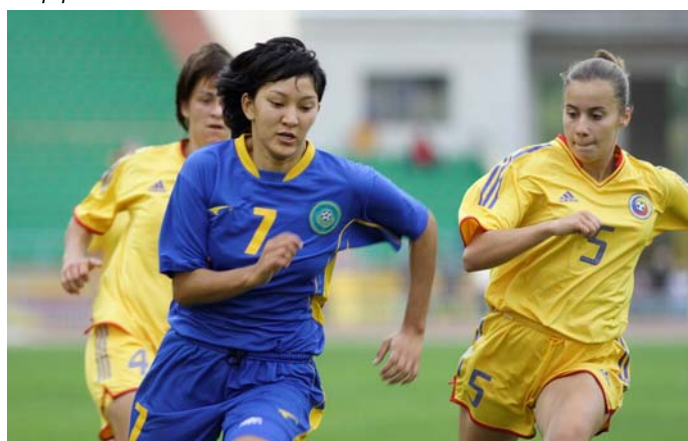
Scène dynamique du match Kazakhstan contre Roumanie