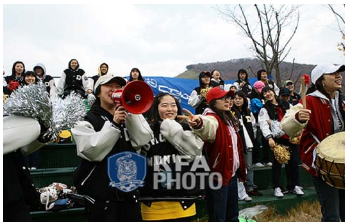
Des fans coréennes enthousiastes.

Quand Joseph S. Blatter lançait en 1995 que « l'avenir est féminin », ce n'était pas juste un slogan - cela impliquait l'intime conviction que le football féminin recèle un extraordinaire potentiel. Depuis lors, la FIFA soutient de manière ciblée les initiatives des associations qui souhaitent offrir aux féminines les mêmes chances de développement qu'à leurs homologues masculins. Depuis que le Programme d'Aide Financière de la FIFA (FAP) a vu le jour en 1998, les associations et confédérations sont tenues d'investir dans le football féminin, depuis 2004 à hauteur de 4% des sommes allouées et depuis 2005 à hauteur de 10%. Cela intervient en parallèle de la promotion globale du football féminin par des financements directs et par l'organisation de compétitions et séminaires. Par le biais de ses programmes de développement, la FIFA joue un rôle actif dans la formation dans des domaines comme administration, entraînement, arbitrage et médecine du sport.