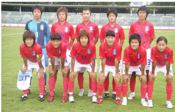
L'équipe olympique féminine de la République de Corée.