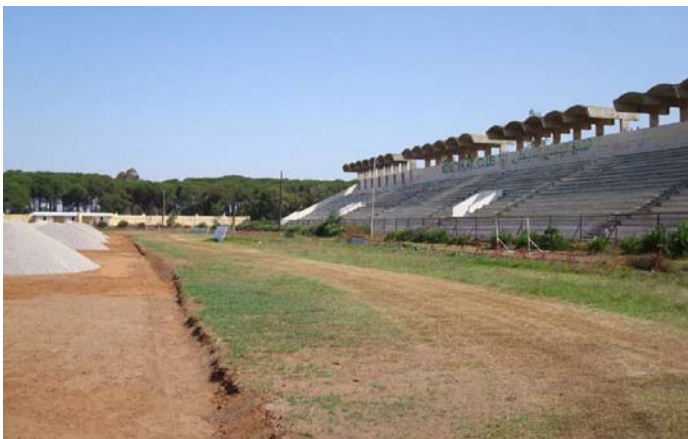
Stade municipal de Kénitra. Capacité d'accueil : 15 000 spectateurs.

Informations additionnels sur le programme: http://fr.fifa.com/mm/goalproject/WinAF_F.pdf