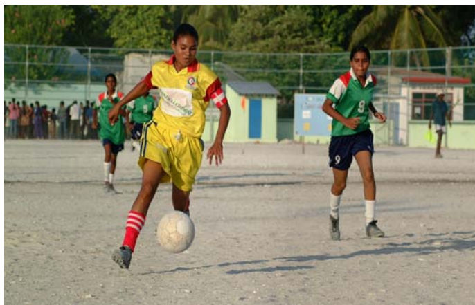
Aucun doute : elles sont aussi élégantes sur sable que sur gazon.

Quand Joseph S. Blatter lançait en 1995 que « l'avenir est féminin », ce n'était pas juste un slogan - cela impliquait l'intime conviction que le football féminin recèle un extraordinaire potentiel. Depuis lors, la FIFA soutient de manière ciblée les initiatives des associations qui souhaitent offrir aux féminines les mêmes chances de développement qu'à leurs homologues masculins. Depuis que le Programme d'Aide Financière de la FIFA (FAP) a vu le jour en 1998, les associations et confédérations sont tenues d'investir dans le football féminin, depuis 2004 à hauteur de 4% des sommes allouées et depuis 2005 à hauteur de 10%. Cela intervient en parallèle de la promotion globale du football féminin par des financements directs et par l'organisation de compétitions et séminaires. Par le biais de ses programmes de développement, la FIFA joue un rôle actif dans la formation dans des domaines comme administration, entraînement, arbitrage et médecine du sport.