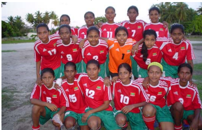
L'équipe féminine juniors des Maldives.