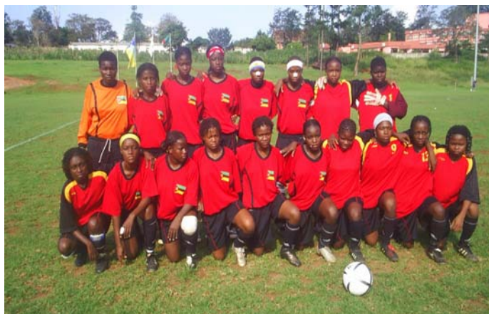
L'équipe féminine U-20 du Mozambique.

Quand Joseph S. Blatter lançait en 1995 que « l'avenir est féminin », ce n'était pas juste un slogan - cela impliquait l'intime conviction que le football féminin recèle un extraordinaire potentiel. Depuis lors, la FIFA soutient de manière ciblée les initiatives des associations qui souhaitent offrir aux féminines les mêmes chances de développement qu'à leurs homologues masculins. Depuis que le Programme d'Aide Financière de la FIFA (FAP) a vu le jour en 1998, les associations et confédérations sont tenues d'investir dans le football féminin, depuis 2004 à hauteur de 4% des sommes allouées et depuis 2005 à hauteur de 10%. Cela intervient en parallèle de la promotion globale du football féminin par des financements directs et par l'organisation de compétitions et séminaires. Par le biais de ses programmes de développement, la FIFA joue un rôle actif dans la formation dans des domaines comme administration, entraînement, arbitrage et médecine du sport.