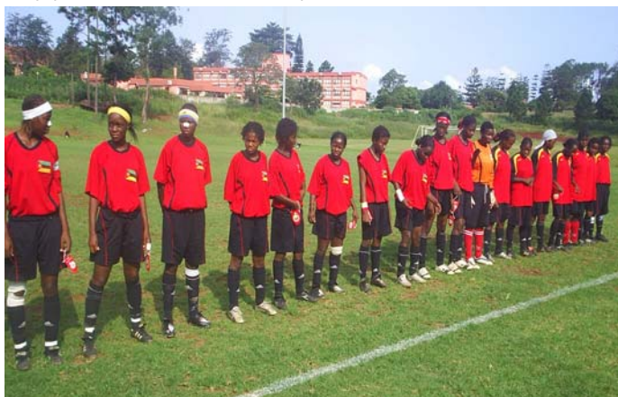
L'équipe U-20 alignée avant le coup d'envoi du match contre la Russie.