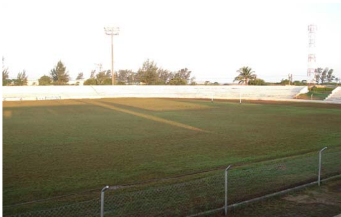
Stade da Machava – un des deux sites du pays disposant de terrains en gazon artificiel homologués par la FIFA.

Informations additionnels sur le programme: http://fr.fifa.com/mm/goalproject/WinAF_F.pdf