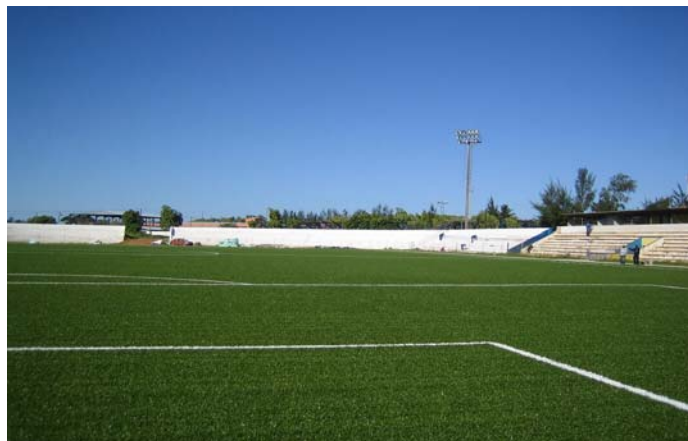
Le Stade de Machava est prêt pour des matches inter-nations.