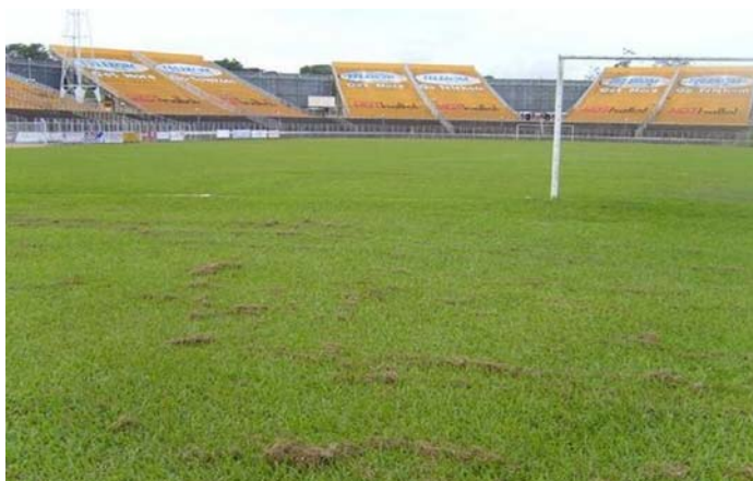
Terrain en gazon naturel du stade Kamuzu à Blantyre. Capacité d'accueil : 40 000 spectateurs.

Informations additionnels sur le programme: http://fr.fifa.com/mm/goalproject/WinAF_F.pdf