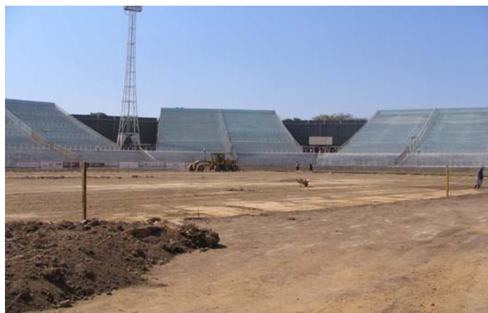
Déblaiement en préparation du nouveau terrain en gazon artificiel.