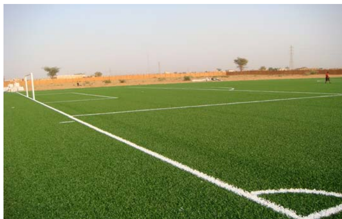
Dans le cadre du programme Goal, un autre terrain en gazon artificiel a été installé dans le centre technique.