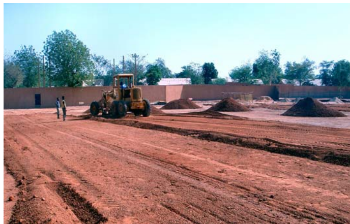
Le stade municipal en pleins travaux dans le cadre du projet « Gagner en Afrique avec l'Afrique ».