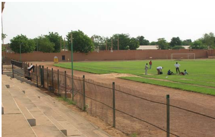
Au vu du terrain en mauvais état du stade municipal de Niamey, il a été décidé de bâtir un terrain en gazon artificiel résistant à toutes les conditions climatiques.

Informations additionnels sur le programme: http://fr.fifa.com/mm/goalproject/WinAF_F.pdf