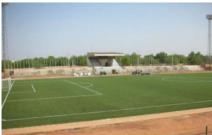
Le nouveau terrain en gazon artificiel avant son inauguration.