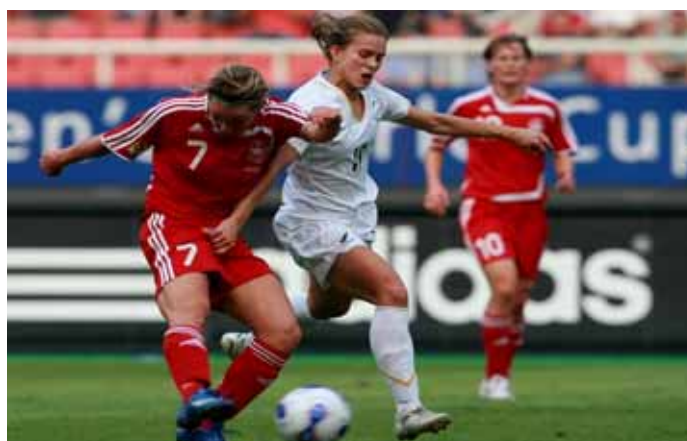
Coupe du Monde Féminine U-20 en Allemagne : contre le Danemark.