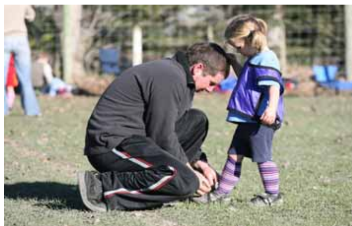
Entraînement à la base.

Quand Joseph S. Blatter lançait en 1995 que « l'avenir est féminin », ce n'était pas juste un slogan - cela impliquait l'intime conviction que le football féminin recèle un extraordinaire potentiel. Depuis lors, la FIFA soutient de manière ciblée les initiatives des associations qui souhaitent offrir aux féminines les mêmes chances de développement qu'à leurs homologues masculins. Depuis que le Programme d'Aide Financière de la FIFA (FAP) a vu le jour en 1998, les associations et confédérations sont tenues d'investir dans le football féminin, depuis 2004 à hauteur de 4% des sommes allouées et depuis 2005 à hauteur de 10%. Cela intervient en parallèle de la promotion globale du football féminin par des financements directs et par l'organisation de compétitions et séminaires. Par le biais de ses programmes de développement, la FIFA joue un rôle actif dans la formation dans des domaines comme administration, entraînement, arbitrage et médecine du sport.