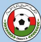
Emblème de l'association