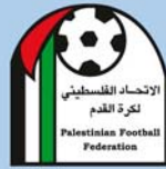
Emblème de l'association