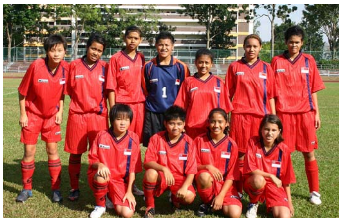
L'équipe nationale féminine U-17 de Singapour.

Quand Joseph S. Blatter lançait en 1995 que « l'avenir est féminin », ce n'était pas juste un slogan - cela impliquait l'intime conviction que le football féminin recèle un extraordinaire potentiel. Depuis lors, la FIFA soutient de manière ciblée les initiatives des associations qui souhaitent offrir aux féminines les mêmes chances de développement qu'à leurs homologues masculins. Depuis que le Programme d'Aide Financière de la FIFA (FAP) a vu le jour en 1998, les associations et confédérations sont tenues d'investir dans le football féminin, depuis 2004 à hauteur de 4% des sommes allouées et depuis 2005 à hauteur de 10%. Cela intervient en parallèle de la promotion globale du football féminin par des financements directs et par l'organisation de compétitions et séminaires. Par le biais de ses programmes de développement, la FIFA joue un rôle actif dans la formation dans des domaines comme administration, entraînement, arbitrage et médecine du sport.