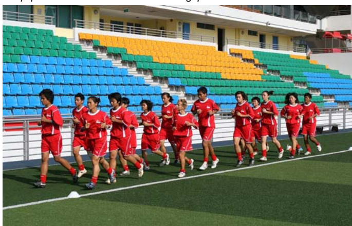
Echauffement pendant un cours d'entraînement à Singapour.