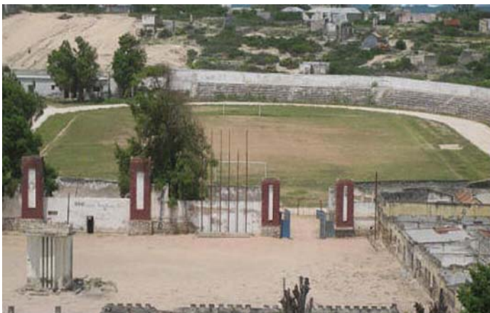
Le stade Benadir de Mogadiscio avant son renovation

Informations additionnels sur le programme: http://fr.fifa.com/mm/goalproject/WinAF_F.pdf