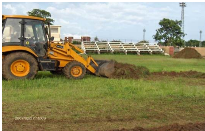
Retrait de l'humus pour préparer la construction des fondations du nouveau terrain en gazon artificiel.