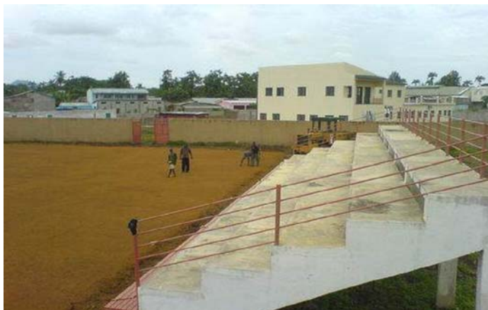
Le terrain en gazon naturel du stade national de São Tomé a souffert de la chaleur et du soleil.

Informations additionnels sur le programme: http://fr.fifa.com/mm/goalproject/WinAF_F.pdf