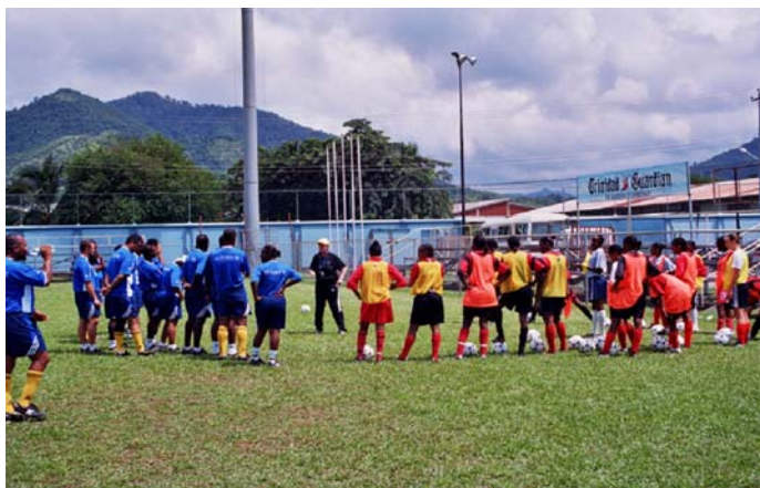
Cours pour instructeurs de football féminin, Port-of-Spain