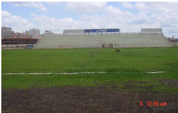
Le stade Nakivumbo de Kampala a une capacité d'accueil de 15 000 spectateurs. Le terrain de football rappelle le rough d'un terrain de golf.

Informations additionnels sur le programme: http://fr.fifa.com/mm/goalproject/WinAF_F.pdf